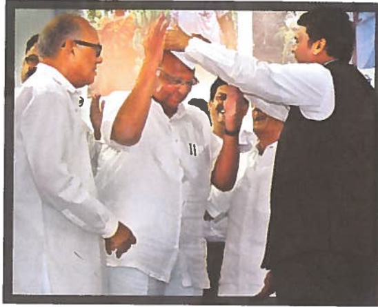
मुख्यमंत्री फडणवीस हे गांधी टोपी शरद पवार यांना घालून अमृतमहोत्सवानिमित्त त्यांचा सत्कार करताना.